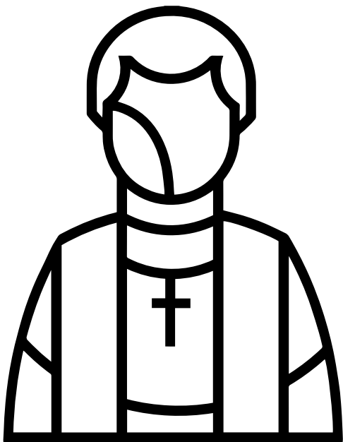
Épiphanie - vert

L'office du ministère chrétien est confié aux pasteurs, mais vous aussi pouvez partager l'Évangile avec touz ceux que vous connaissez.